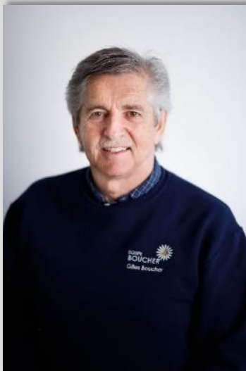
Gilles Boucher, Président de l'agglomération de Sainte-Marguerite-Estérel